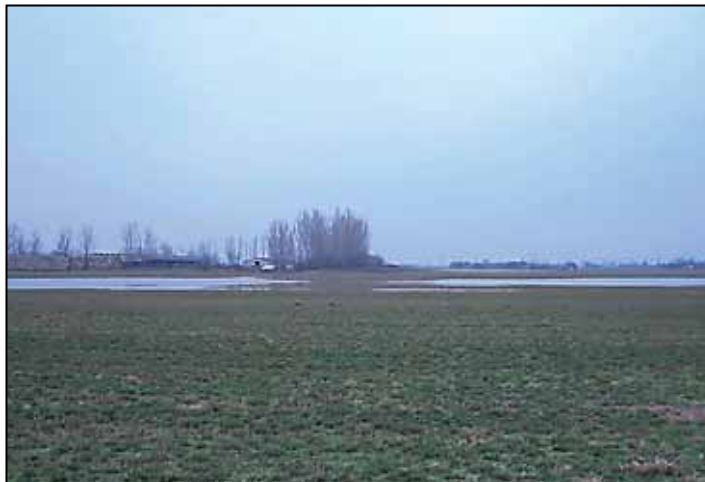
A határ a legtöbb hely így néz ki, de a belvíz már lakott területeket is veszélyeztet