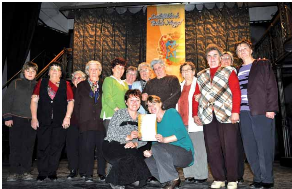
A díjátadást követő önfelelt öröm

ket hetekkel korábban nagy odaadással készítettünk el, és ami már a színpadra vonulásunkkor megtette a hatását. A Hófehérke paródia előadásán mindenki a legtöbbit hozta ki magából, amit a közönség tapsviharral jutalmazott. Miután túl voltunk a nehezén, jólesően néztük végig a többi fellépő színvonalas műsorát. Az újabb izgalom akkor fogott el bennünket, amikor felkonferálták az eredményhirdetést, és a zsűri elnöke pár mondatban értékelte a nap eseményeit, majd átadta a különböző minősítésű okleveleket. Lelkes kis csapatunk kitörő örömmel vette tudomásul, hogy a szakma arannyal jutalmazta őket. Ezek után természetesen önfelelt nótázással telt a hazafelé vezető út. Egyöntetűen állapítottuk meg, hogy nem fáradtunk hiába!