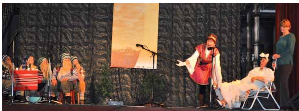
Két jelenet az előadásból