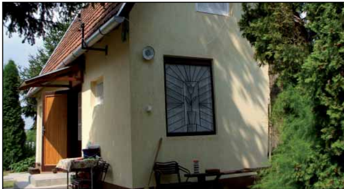
Az a legbiztosabb, ha télire nem hagyunk komoly értéket nyaralónkban

Először a bejutást kell megakadályozni mindenekelőtt az ajtókat, ablakokat kell biztonsági ráccsal ellátni, itt természetesen a pinceablaktól a külső padlásajtóig mindegyiket védeni kell. A létrát sem kell az udvaron hagyni, felkínálni a padlásajtó vagy az emeleti